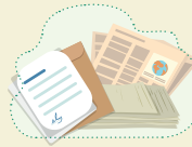
Documents papiers (courriers, journaux...)